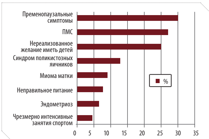
РИСУНОК 1. АНАМНЕЗ ПРИ ПЕРВОМУ ПОСЕЩЕНИИ: ЧАСТОТА ОСНОВНЫХ ЗАБОЛЕВАНИЙ И РАССТРОЙСТВ

Пременопаузальні симптоми були зафіксовані в 30% випадків, ПМС – у 27% жінок, 25% учасниць дослідження не реалізували своє бажання мати дітей (рис. 1).