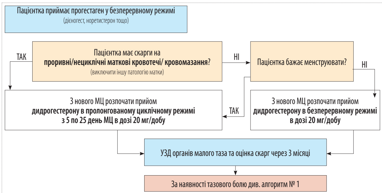
Рисунок 3. Алгоритм № 2: Перехід на дидрогестерон з інших прогестагенів (у разі недостатнього ефекту, побічних явищ, індивідуальної поганої переносимості тощо)