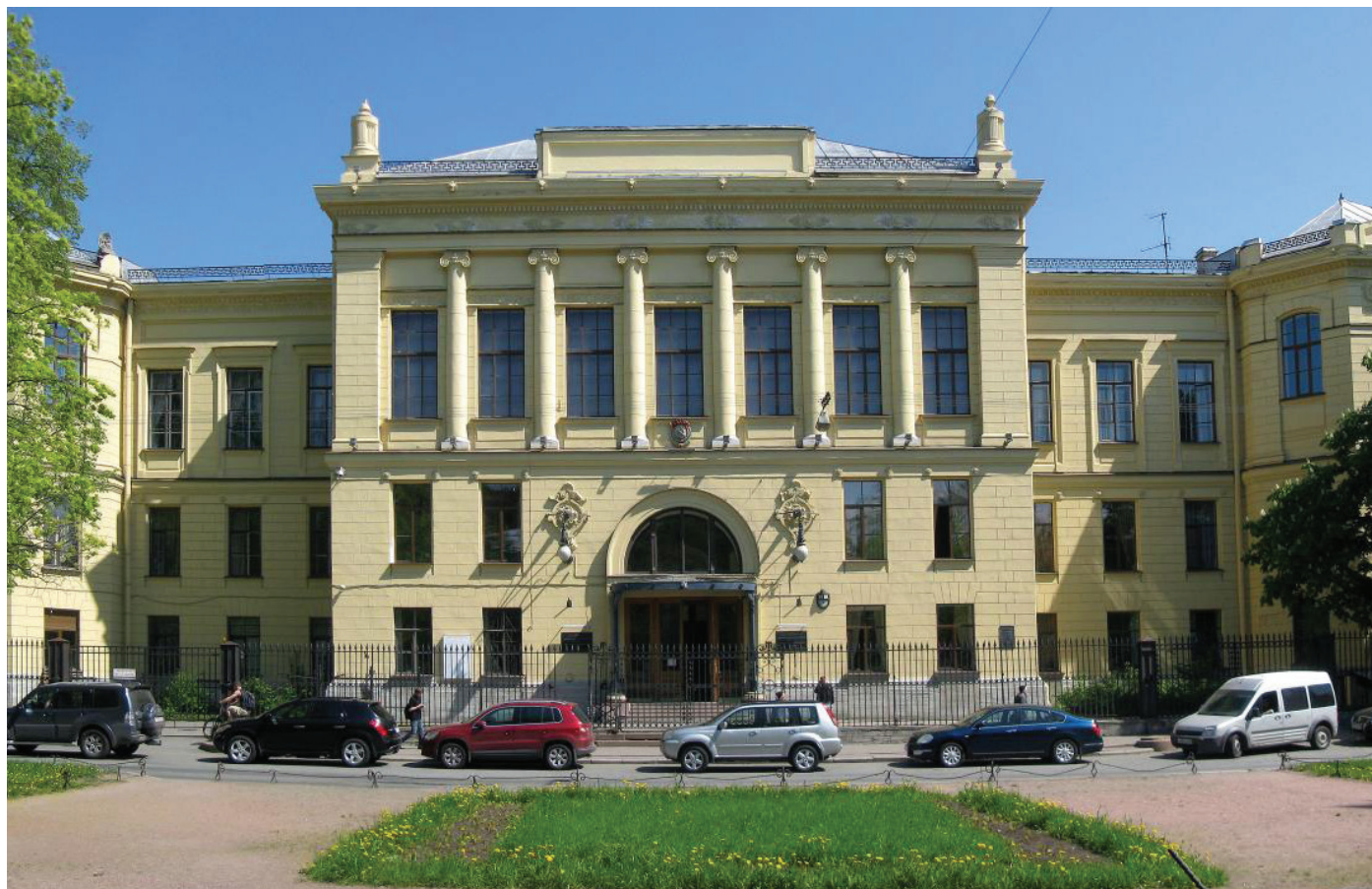
II Национальный конгресс «Дискуссионные вопросы современного акушерства» прошёл в Санкт-Петербурге в ФГБУ НИИ акушерства и гинекологии им. Д.О. Отта

прогестерона на поздних сроках гестации у пациенток с преждевременными родами в анамнезе привело к снижению частоты преждевременных родов, перинатальной и неонатальной смертности. Кроме того, снизилась частота рождения детей с низкой массой тела, доля детей с нарушениями психомоторного развития и нарушениями слуха.