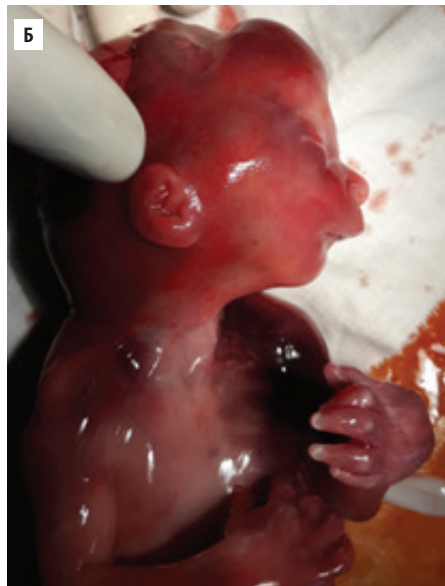
Рисунок 6А, Б. Абортус 20 нед. гестации с ФКУ и двусторонней агенезией почек. А – анфас, Б – профиль

Отмечаются фенотипические проявления аномалада Поттера.