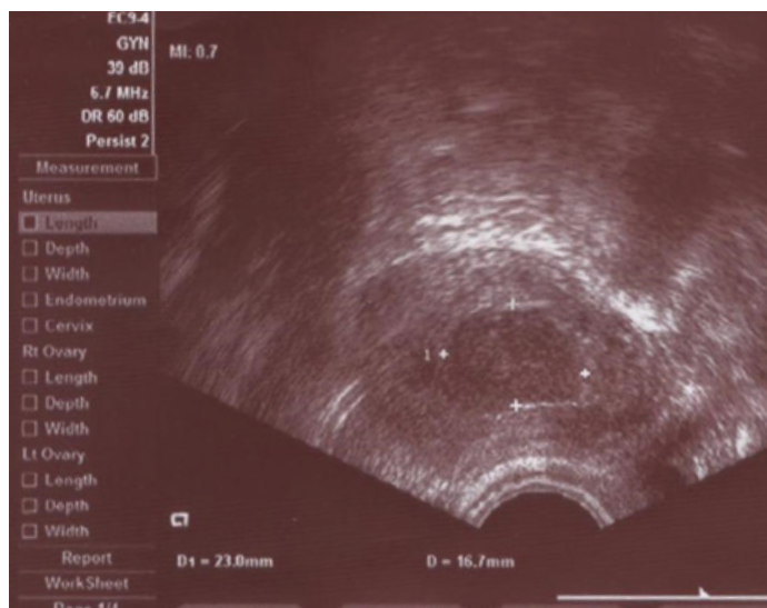
Рисунок 3. Пациентка М. Узловая форма аденомиоза (январь 2016)