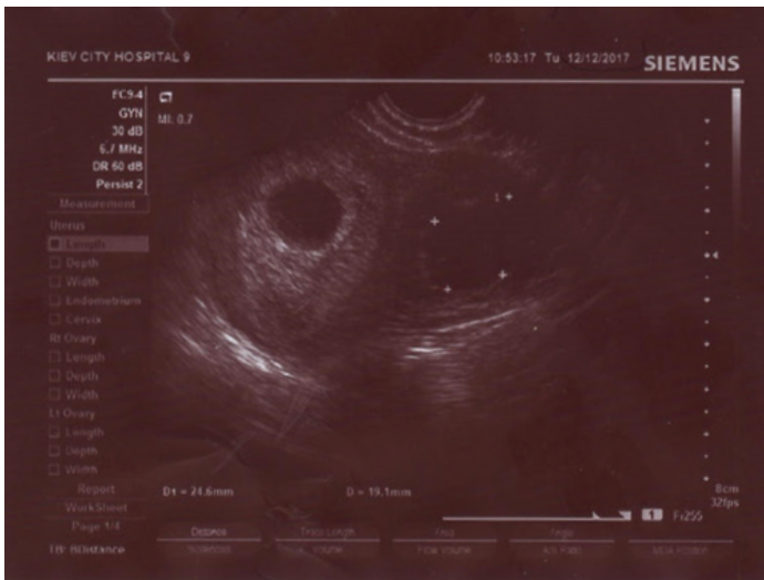
Рисунок 4. Пациентка М. Беременность 4 нед. Узловая форма аденомиоза (декабрь 2017)

Заключение: беременность 4 нед. Узловая форма аденомиоза.